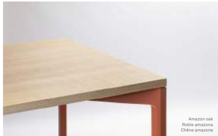
Amazon oak Roble amazona Chêne amazone