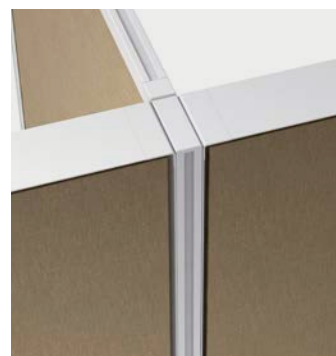
Panel Slim + Panel System